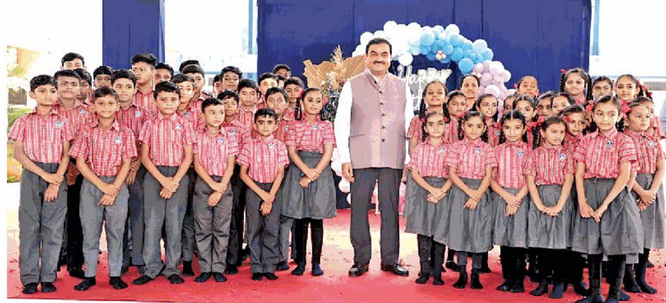
गौतम अदाणी ने अपना 60वां जन्मदिन मुंबा स्थित अदाणी क्वामटिर के क्लब के साथ मनाया। क्लब की मुख्यमन में उन्होंने पाई अपने जन्मदिन की सबसे कीमती भेंट।

सफलता-असफलता तो जीवन का हिस्सा है। असफलता से डरना या झुकना नहीं है। बचपन में शिवमंगल सिंह सुमन की इन पंक्तियों ने मुझ पर अमिट छाप छोड़ी थी: क्या हार में क्या जीत में, किंचित नहीं भयभीत में, संघर्ष पथ पर जो मिले, यह भी सही, वह भी सही, वरदान मांगूंगा नहीं।